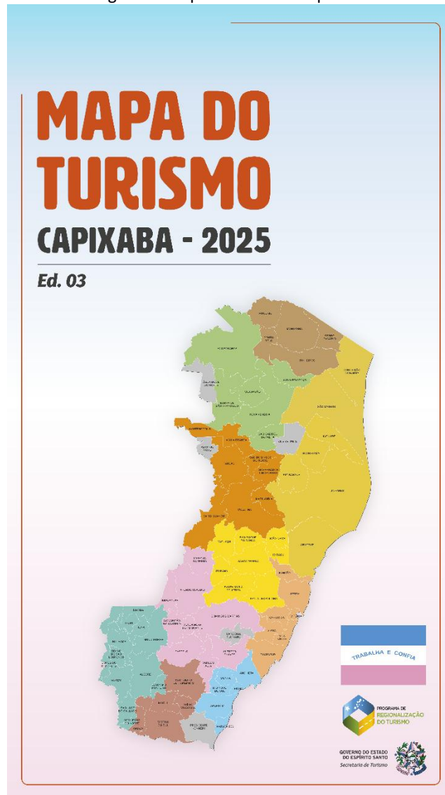
Figura 3: Mapa do turismo capixaba