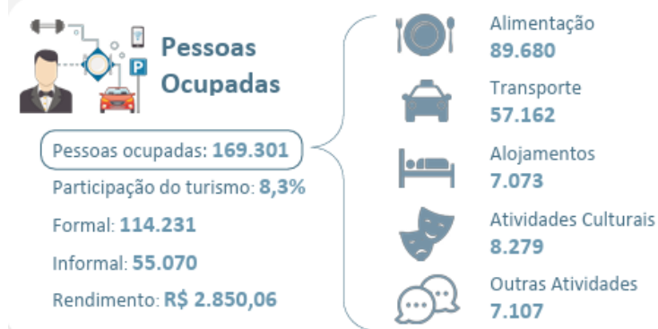
Figura 1: Ocupações no turismo no Espírito Santo no 2º trimestre de 2025

Nesse contexto, o curso reafirma o compromisso do Ifes com a formação de profissionais capazes de contribuir para a consolidação de um turismo sustentável, inclusivo e responsável, em sintonia com as metas de desenvolvimento regional e com a visão estratégica de longo prazo do Espírito Santo, que enxerga o turismo como uma ferramenta de transformação econômica, social e cultural. De acordo com o Boletim de Economia do Turismo – 2º Trimestre de 2025, elaborado pelo Instituto Jones dos Santos Neves (IJSN) e pela Secretaria de Estado de Turismo do Espírito Santo (SETUR-ES), as atividades características do turismo empregam cerca de 91.370 pessoas, o que representa aproximadamente 8,3% do total de pessoas ocupadas no Estado. O rendimento médio real habitual dos trabalhadores do setor turístico foi estimado em R$ 2.850,06, com massa de rendimento de R$ 476,52 milhões no mesmo trimestre. Esses indicadores demonstram a relevância econômica e social do turismo capixaba e reforçam a necessidade de fortalecer a formação técnica e profissional de qualidade voltada ao setor (Espírito Santo, 2025).