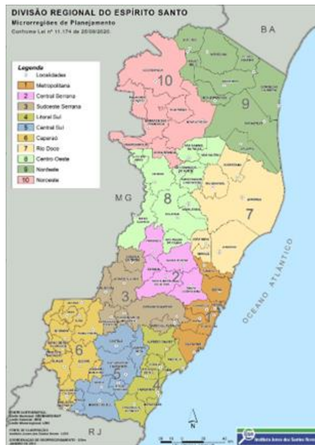
Figura 1 – Divisão regional do Espírito Santo: microrregiões de planejamento